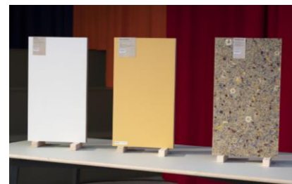
Resultaten deelnemers Circular Design Challenge 2021: Plastiform Ommen, Berkvens